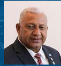
Frank Bainimarama Primer Ministro Por el Gobierno de Fiyi