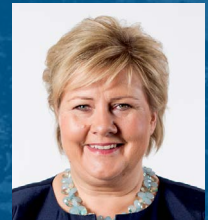
Erna Solberg Primera Ministra Por el Gobierno de Noruega