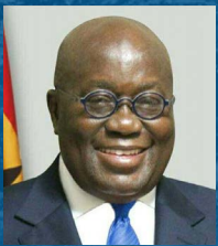
Nana Addo Dankwa Akufo-Addo Presidente Por el Gobierno de Ghana