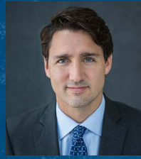
Justin Trudeau Primer Ministro Por el Gobierno de Canadá