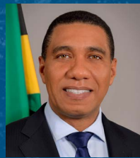
Andrew Holness Primer Ministro Por el Gobierno de Jamaica