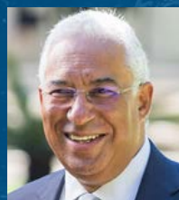
António Costa Primer Ministro Por el Gobierno de Portugal