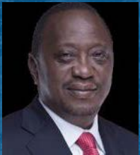
Uhuru Kenyatta Presidente Por el Gobierno de Kenia