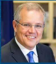
Scott Morrison Primer Ministro Por el Gobierno de Australia