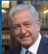
Andrés Manuel López Obrador Presidente Por el Gobierno de México