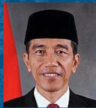
Joko Widodo Presidente Por el Gobierno de Indonesia