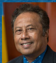
Tommy Remengesau, Jr. Presidente Por el Gobierno de Palaos