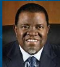
Hage G. Geingob Presidente Por el Gobierno de Namibia