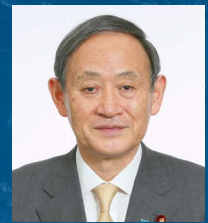
Yoshihide Suga Primer Ministro Por el Gobierno de Japón