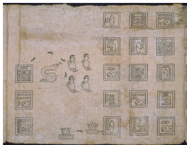
Paso de los Mexicas por Coatitla (Tira de la Peregrinación o Códice Boturini).

que en 1428 los Mexicas instituyeron su linaje en los gobernantes del Señorío de Ecatepec.