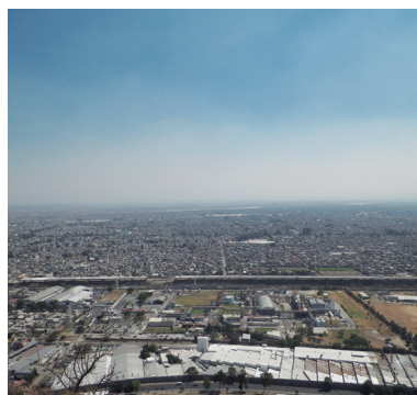
Zona industrial de Ecatepec (Guillermo Escobar, 2019).

Chiconautla, Santa María Tulpeticlac, Santa Clara Coatitla, San Pedro Xalostoc, Guadalupe Victoria, San Isidro Atlautenco y San Andrés de la Cañada), así como 12 barrios, 181 fraccionamientos y 345 colonias. Pasamos de ser un municipio con vocación eminentemente agrícola, a ser un municipio industrial, sin embargo; los que somos oriundos o