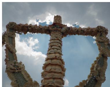
Fiesta de la Santa Cruz en el Ehecatepetl (Guillermo Escobar, 2019).

El Ciclo Festivo inicia el 03 de mayo, día de la Santa Cruz. En San Cristóbal Ecatepec de Morelos la celebración da inicio con la bendición de cruces en el atrio del templo. La cruz es llevada en procesión hasta la cima del Ehecatepetl. En la cúspide del cerro se celebra una misa y posteriormente, sobre un amontonamiento de rocas, se levanta la