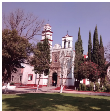
Templo de Santo Tomás Apóstol en Chiconautla (Angélica Rivero López, 2017).

Rey en el Pueblo de Santa María Tulpetlac. El 30 de noviembre es la fiesta patronal de San Andrés Apóstol en la Cañada. El 12 de diciembre se celebra a la Virgen de Guadalupe en el Santuario de la Quinta Aparición en el Pueblo de Santa María Tulpetlac y en el pueblo de Guadalupe Victoria; y finalmente el ciclo festivo de los pueblos concluye el 21 de diciembre con la fiesta de Santo Tomás Apóstol en Chiconautla.