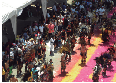
Danzantes frente al Templo de San Cristóbal (Angélica Rivero López, 2017).

El 15 de mayo la fiesta patronal de San Isidro Labrador se celebra en el Pueblo de Atlautenco. Antiguamente los pobladores acudían al templo con sus mulas, burros y caballos adornados. El 29 de junio se celebra con gran algarabía a San Pedro Apóstol en el Pueblo de Xalostoc. Esta festividad es una de las más coloridas, ya que participan un gran número de comisiones para los preparativos. Son características sus procesiones por las calles del pueblo decoradas con hermosos tapetes multicolores de aserrín. El 01 de julio se festeja la Preciosa Sangre de Cristo en el Pueblo de Santa María Chiconautla. El Ciclo Festivo