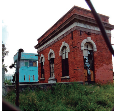
Compuerta ubicada en El Dique (Alberto Medina Rodríguez, 2020).

A mediados del siglo XVIII el Real Tribunal del Consulado construyó la Casa del Real Desagüe; poco tiempo después se le llamó Palacio de los Virreyes, en virtud de que los gobernantes recibían en este lugar el