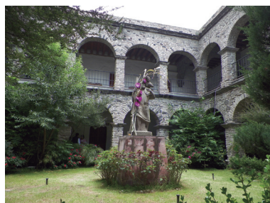
Convento Franciscano de San Cristóbal (Guillermo Escobar, 2018).

y los poblados de Ecatepec recibieron nombres católicos. Tocó a los franciscanos asumir el dominio eclesiástico en Chiconautla. San Cristóbal, en cambio; fue el lugar