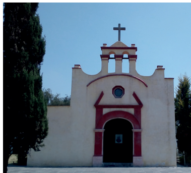
Capilla de San Juan Bautista (Guillermo Escobar, 2019).

También, se construyeron pequeñas capillas en San Cristóbal Ecatepec como la del Calvario (Barrio del Calvario), San José (Barrio de San José Jajalpa), San Juan Evangelista (Barrio de San Juan Acalhuacan).