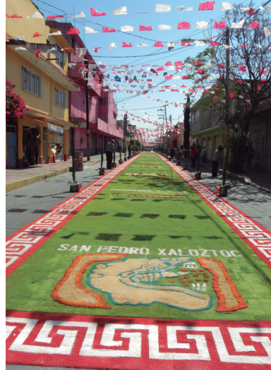
Tapetes multicolores de aserrín en el Pueblo de San Pedro Xalostoc (Angélica Rivero López, 2017).

Conozca el Santuario de la Quinta Aparición Guadalupana en el Pue-