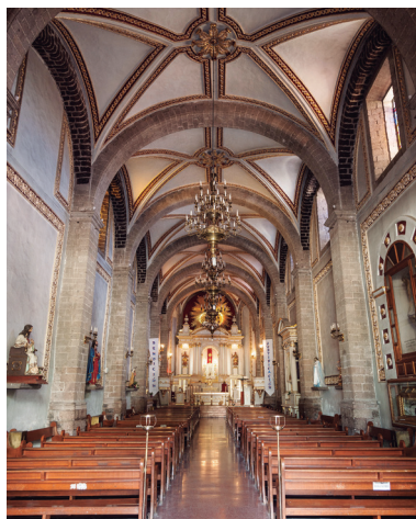
Templo de San Cristóbal.

Ecatepec de Morelos cuenta con un importante acervo de patrimonio cultural como lo son los monumentos históricos. Como bellas estampas tradicionales y sobrias, a raíz de la evangelización se construyeron con piedras y esculturas de los templos prehispánicos seis templos coloniales de los siglos XVI y XVII con retablos barrocos y neoclásicos, que representan el espíritu de la comunidad y que fueron advocates a San Cristóbal (Ciudad San Cristóbal Ecatepec de Morelos), La Natividad